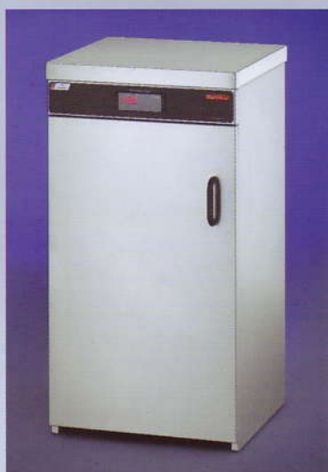
Modell-Nr. 2009 Model-no. 2009