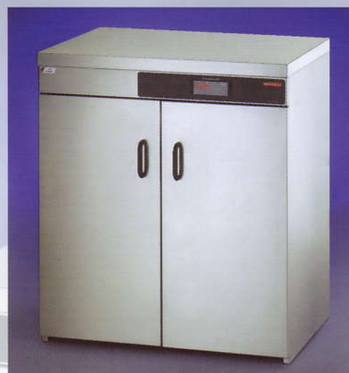
Modell-Nr. 2012 Model-no. 2012

DEUTSCH Ausführung: Edelstahl rostfrei mit 1 Flügeltür (Modell 2009) und 2 Flügeltüren (Modell 2011 / 2012), 1 verstellbares Zwischenbord, Digital -Thermostatisch regelbar von 30-90°C.