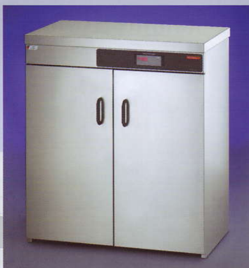
Modell-Nr. 2011 Model-no. 2011